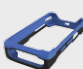
■ 94ACC0132 Carcasa de goma