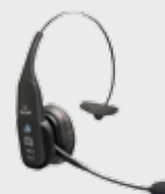
■ 94ACC0127 Cascos Bluetooth VXI B350-XT