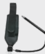
■ 94ACC0133 Correa de mano (incluida)